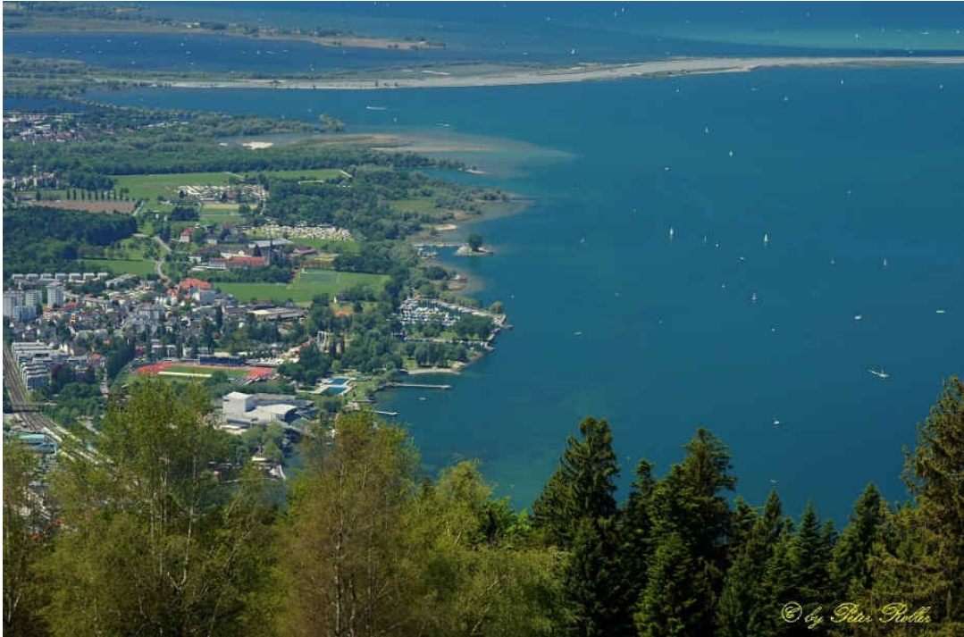
Blick vom Pfänder auf die Rheinmündung