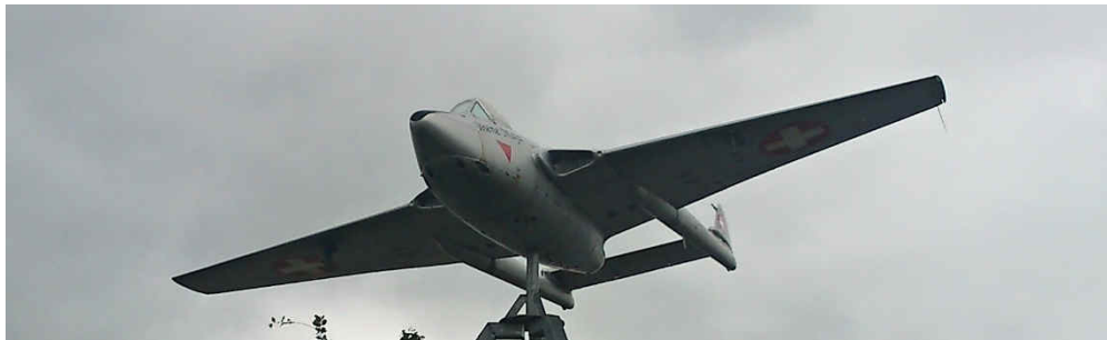
Am Kreisverkehr bei der „Hundertwasser Markthalle“ in Altenrhein