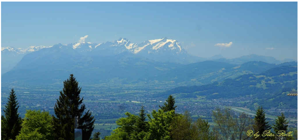
Blick vom Pfänder auf das Rheintal und die Schweizer Alpen

*** bei guter Sicht herrliches Panorama über den gesamten See und die Alpen