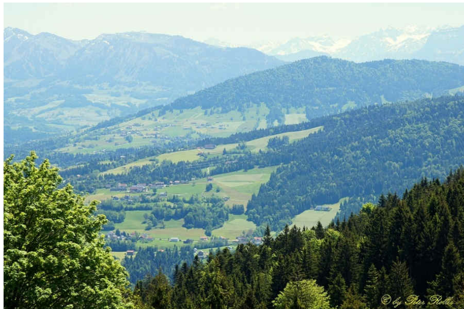
Blick auf die Vorarlberger Alpen