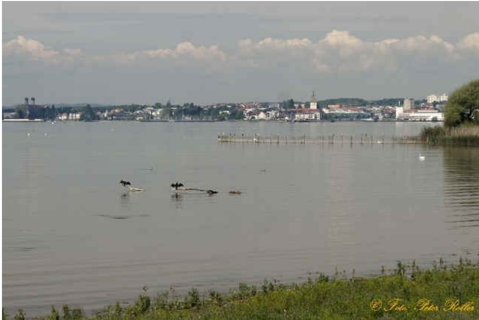
Blick aus dem Eriskirchener Ried nach Friedrichshafen