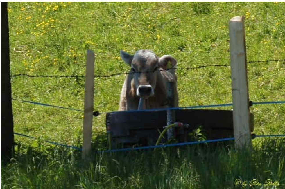
Alpe an der Bregenzer Käsestraße