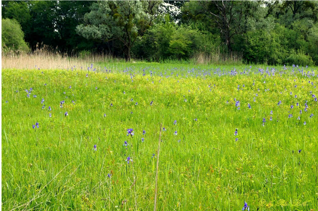
Sumpf mit blühenden Irisblüte im Eriskirchener Ried